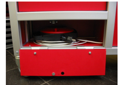
Detailansichten: Spannungsversorgung und Netzwerkanschlusskabel