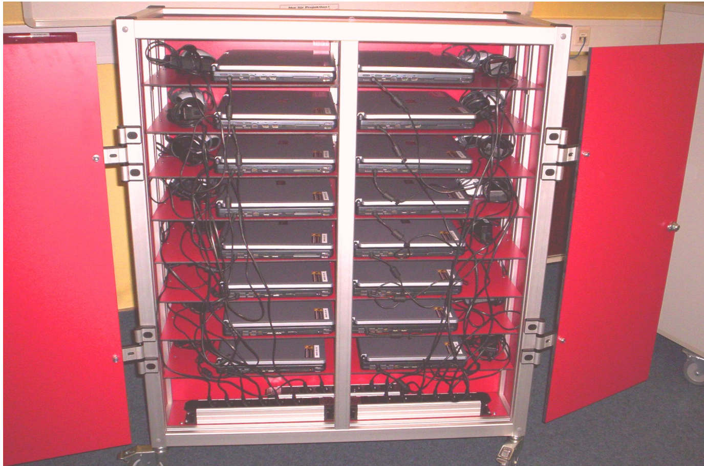
Notebookwagen bestückt mit 16 Geräten, Netzteilen und Mäusen (verdeckt hinter den Steckdosenleisten ist der Access Point installiert)